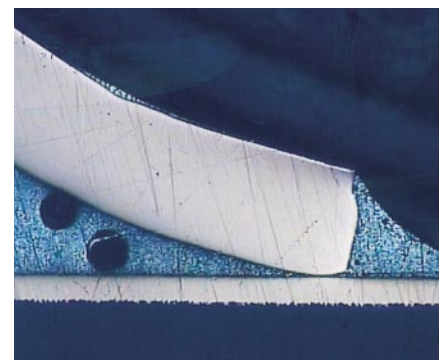
Fig. 5 - Microsezione di un giunto di controllo utilizzando una lega stagno-piombo