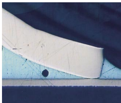
Fig. 4 - Microsezione del terminale in rame di un transistor utilizzando la lega lead-free Ecosol® TSC

labilità, disponibilità e temperatura del punto di fusione. Alcune aree delle schede AB, inevitabilmente più sensibili di altre alla temperatura, hanno richiesto lo sviluppo di uno speciale profilo di rifusione per assicurare che nessun componente fosse esposto ad eccessivo riscaldamento durante la saldatura. "Questo aspetto rappresentava una grossa sfida, ma con l'aiuto di Multicore siamo riusciti a sviluppare un profilo di rifusione ottimale per la lega saldante lead-free contenente stagno-argento-rame che non sottoponesse i componenti ai problemi associati al riscaldamento", aggiunge Kennard.